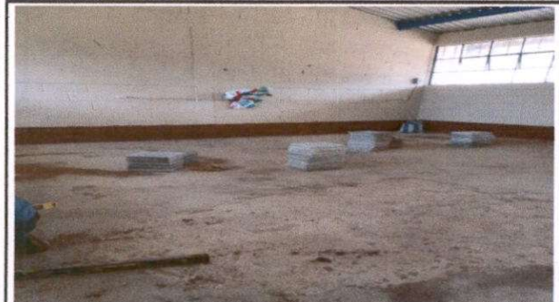
Foto 1: Sustitución de piso de torta de concreto por piso granito (aula 1)