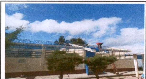
Foto 5: Sustitución de lámina por l'pamina troquelada aluzinc calibre 26.

Observación: Si es necesario se pueden agregar hojas adicionales y adjuntarlas al final de las hojas.